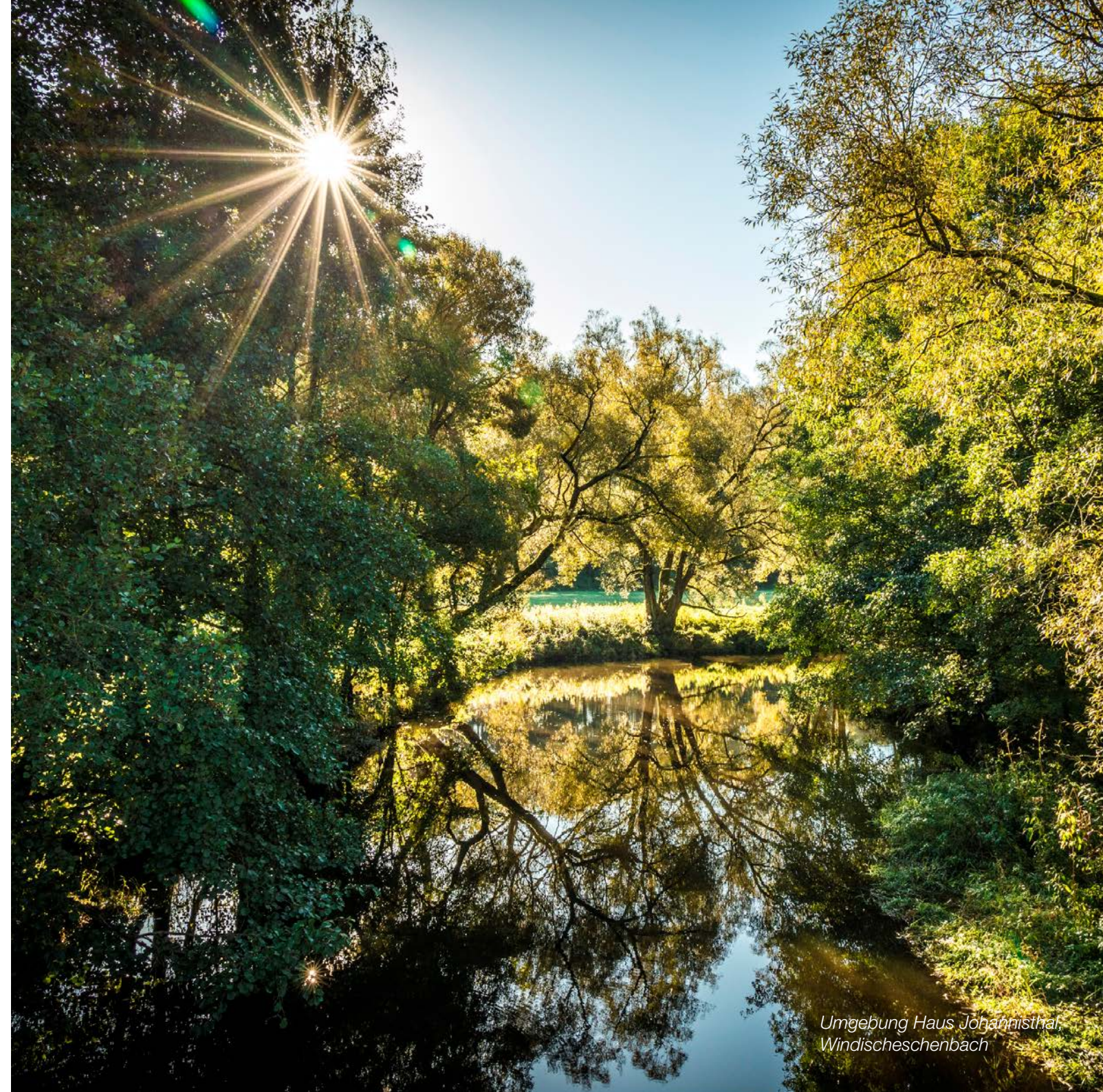
Umgebung Haus Johannisthal, Windischeschenbach