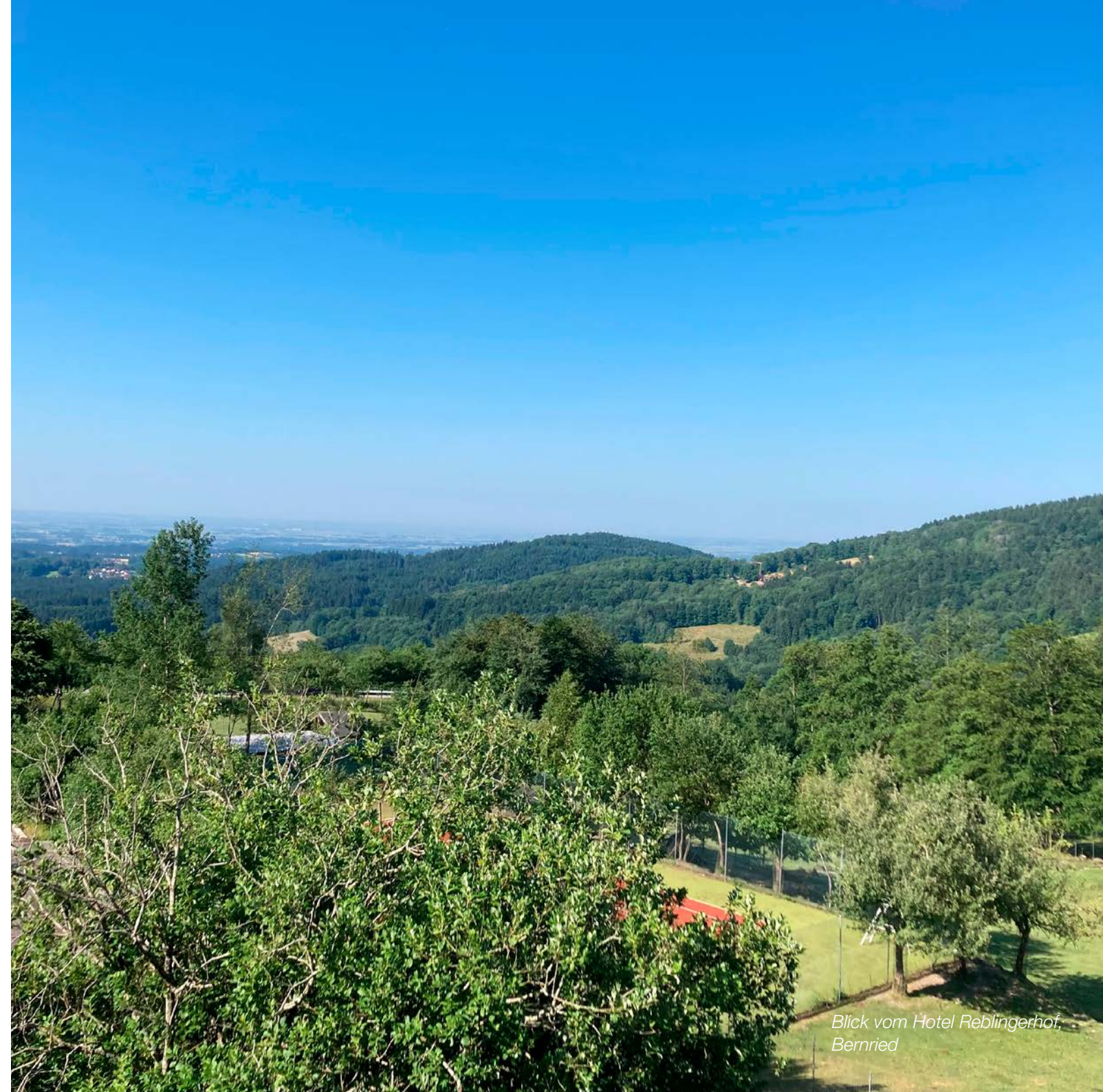
Blick vom Hotel Reblingerhof, Bernried